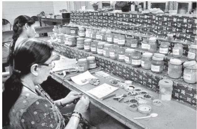
ഗവേഷണ വികസന മേഖലകളിലെ മുന്നേറ്റം

രാജ്യത്ത് ആകെ 50475 രജിസ്റ്റേർഡ് യൂനാനി ഡോക്ടർമാർ ആരോഗ്യ മേഖലയിൽ സേവനമനുഷ്ഠിക്കുന്നു. ഇന്ത്യയിൽ നിലവിൽ 259 യൂനാനി ആശുപത്രികളുണ്ട്. ഇവയിൽ 3744 കിടക്കകളും ഉണ്ട്. ഇതു കൂടാതെ 1483 യൂനാനി ഡിസ്പൻസറികളും പ്രവർത്തിക്കുന്നു. 2002 ലെ ഇന്ത്യൻ മെഡിസിൻ ആൻഡ് ഹോമിയോപതി ദേശീയ നയം പ്രകാരം പ്രാഥമിക ആരോഗ്യ പരിചരണ ശൃംഖലയിൽ യൂനാനി വൈദ്യശാസ്ത്രത്തെയും ഉൾപ്പെടുത്തിയിട്ടുണ്ട്. യൂനാനി ഡോക്ടർമാരുൾപ്പെടെ 11650 ആയുഷ് ഡോക്ടർമാരെയാണ് ദേശീയ ഗ്രാമീണ ആരോഗ്യ ദൗത്യം കരാർ വ്യവസ്ഥയിൽ പ്രാഥമിക സാമൂഹിക ആരോഗ്യ കേന്ദ്രങ്ങളിൽ നിയമിച്ചിരിക്കുന്നത്. ആയുഷ് ഡോക്ടർമാരായി ശിശു ആരോഗ്യ പദ്ധതി, സ്കൂൾ ആരോഗ്യ പദ്ധതി എന്നിവയിലും യൂനാനി ഡോക്ടർമാർ പ്രവർത്തിക്കുന്നുണ്ട്.